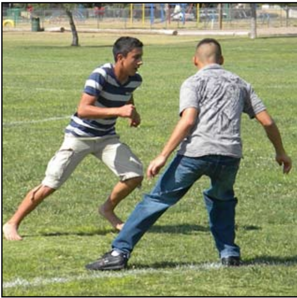
Jóvenes juegan fútbol antes de oración.